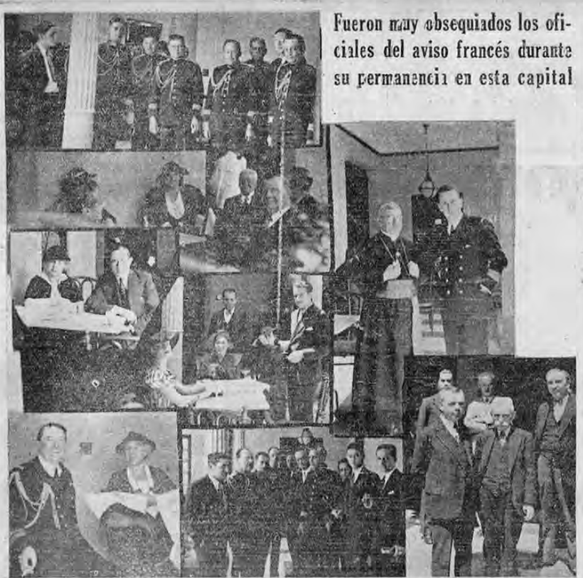
Fueron muy obsequiados los oficiales del aviso francés durante su permanencia en esta capital